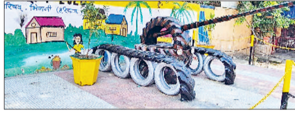
भिवानी। एक प्लाईवुड पर बनाया गया टायरों से टैंक का दृश्य।

मार्च के पहले या दूसरे सप्ताह से जिला के शहरी क्षेत्र में स्वच्छ सर्वेक्षण-2025 शुरू होगा। स्वच्छता सर्वेक्षण 12500 अंक का होगा। स्वच्छता कार्य का सर्वे शहरी आवास केंद्रीय मंत्रालय की टीम द्वारा किया जाएगा। सर्वे कार्य में नगर परिषद या नगर पालिका द्वारा भिवानी शहर के साथ-साथ कस्बा बवानीखेड़ा, सिवानी और लोहारू में स्वच्छता पर किए गए कार्य व प्रयासों को देखने के साथ-साथ आमजन से भी राय ली जाएगी।