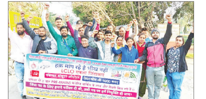
भिवानी। मांगों को लेकर नारेबाजी करते हुए।

दीक्षित के अनुसार एलसीएलओ कर्मचारियों के साथ लगातार अन्याय और उपेक्षा की जा रही है, जिससे कर्मचारियों में भारी असंतोष है। युनियन ने भर्ती प्रक्रिया में विसंगतियों को लेकर सरकार को घेरा है। उन्होंने कहा कि दो-दो कड़े एजमा पास करने और 1000 शुल्क जमा करने के बाद भी योग्य