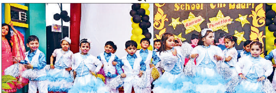
चरखी दादरी। उत्सव में सांस्कृतिक कार्यक्रमों की प्रस्तुति देते विद्यार्थी