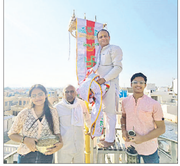
चरखी दादरी। श्रीशीतल नाथ जैन मंदिर में ध्वजारोहण करते श्रद्धालु।