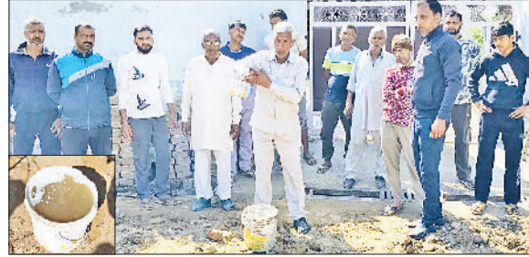
भिवानी। बापोड़ा में घरों में पहुंचा दूषित पानी की सफ़ाई व गंदे पानी की सफ़ाई के विरोध में नारेबाजी करते लोग।

हैं। ग्रामीणों ने सरकार और प्रशासन की खिलाफ जमकर विरोध प्रदर्शन किया और चेतावनी दी है कि अगर जल्द समाधान नहीं हुआ तो वे बड़ा