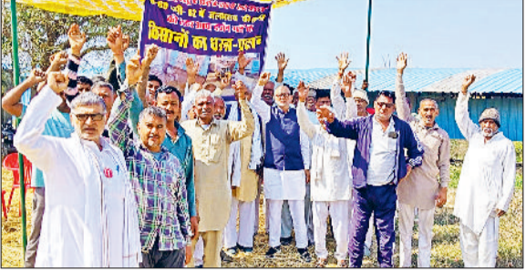
भिवानी [ओपन फाटक की मांग को लेकर नारेबाजी करते हुए।