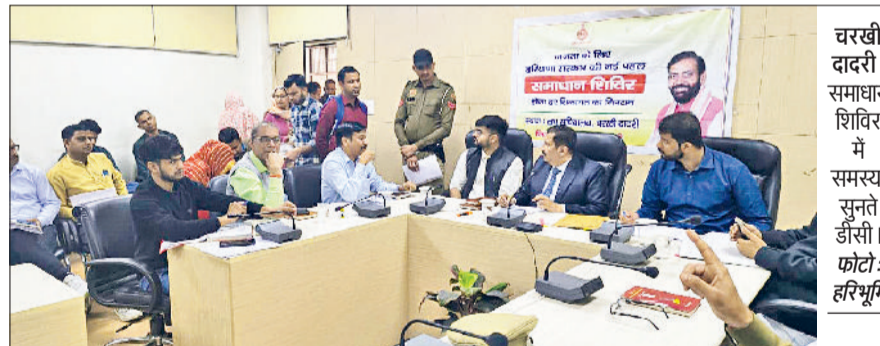
चरखी दादरी। समाधान शिविर में समस्या सुनते डीसी।